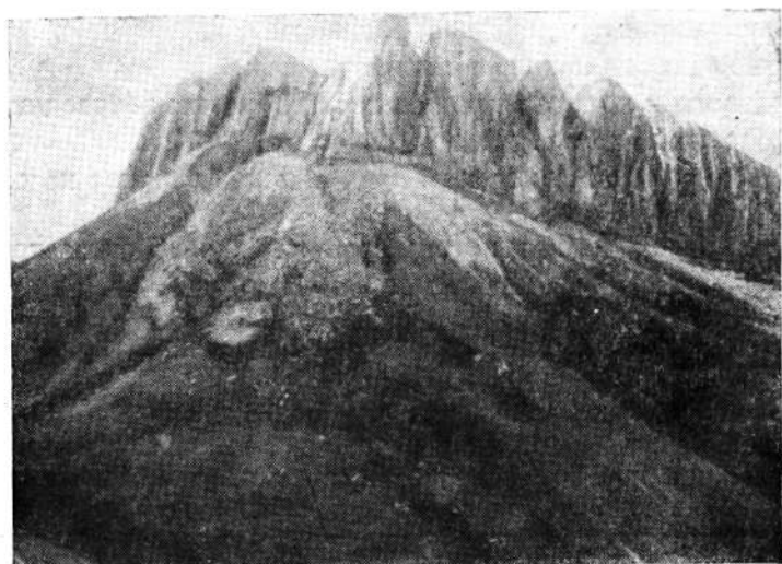
Западная вершина г. Ачешбок.

Проф. Туровым был составлен список млекопитающих Кавказского заповедника из 40 форм. Таким образом, число форм, известных со времени Н. Я. Динника, увеличилось вдвое.