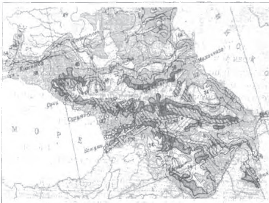
Рис. 3. Места находок на Кавказе белобровиков, окольцованных в Западной Европе

европейские области зимовок и Кавказ, позволяет предполагать, что выбор направления миграции происходит скорее непосредственно в гнездовых районах или близко от них. Но, если птица значительно продвинулась в сторону Западной Европы, она вряд ли способна повернуть на восток. Таким образом, несмотря на высокую степень номадности рассматриваемых видов, особенно вьюрка, данных о том, что птицы способны преодолеть расстояние в 1-3 тыс. км между Европой и Кавказом в ходе зимних кочевок одного сезона нет. В литературе есть данные только о перелетах в 500-700 км в пределах Западной Европы в одну и ту же зиму (Zink, 1985; Cramp, 1993 и др.).