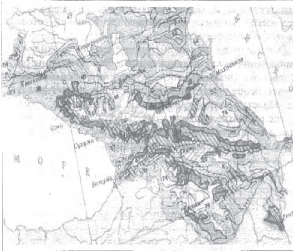
Рис. 4. Места находок на Кавказе вьюрков, окольцованных в Западной Европе

Выделы растительности с наибольшим количеством находок птиц: 38 – Северокавказские и крымские предгорные и горные дубовые и дубово-грабовые ( Quercus robur , Q. petraea , Carpinus caucasica ) леса; 47 – Предгорные смешанные ( Fagus orientalis , Castanea satiba , Quercus Hartwissana ) широколиственные леса с вечнозелеными ( Rhododendron ponticum , Laurocerasus officialis и др.) элементами (Сочава, 1964)