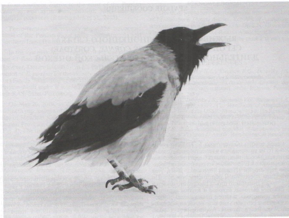
Рис. 1. Задержавшийся в развитии птенец серой вороны. 10.11.2016 г.

хвоей (лиственница). Ноябрь выдался зимним месяцем, на 1-4^{\circ}\text{C} холоднее обычного, без оттепелей. В самые холодные дни в середине ноября среднесуточные температуры были на 11-12^{\circ}\text{C} ниже обычного — минимальная опускалась до -25, -27^{\circ}\text{C} . Часто выпадали осадки в виде снега, мокрого снега, дождя. После сильной метели 8 ноября установился высокий снеговой покров, а 13–14 ноября наблюдалось редкое явление — “ледяной дождь” и ветки деревьев покрылись ледяной коркой, под тяжестью которой ломались. За ноябрь снега выпало на 15% выше средних значений. Декабрь тоже оказался холодным и многоснежным, температура воздуха по ночам опускалась до -30-40^{\circ}\text{C} и ниже, днем — от -10 до -28^{\circ}\text{C} .