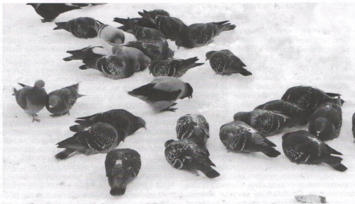
Рис. 4. Безуспешное кормление с голубями. 22.12.2016 г.