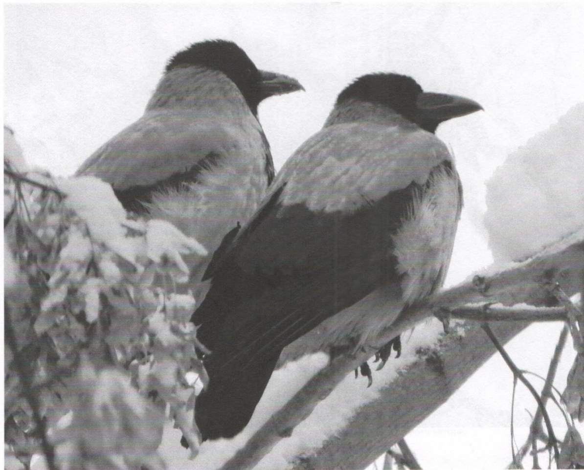
Рис. 6. Родители наблюдают за потомком. 10.12.2016 г.

не тополя. Иногда пытался клевать, но у него по-прежнему не получалось глотать.