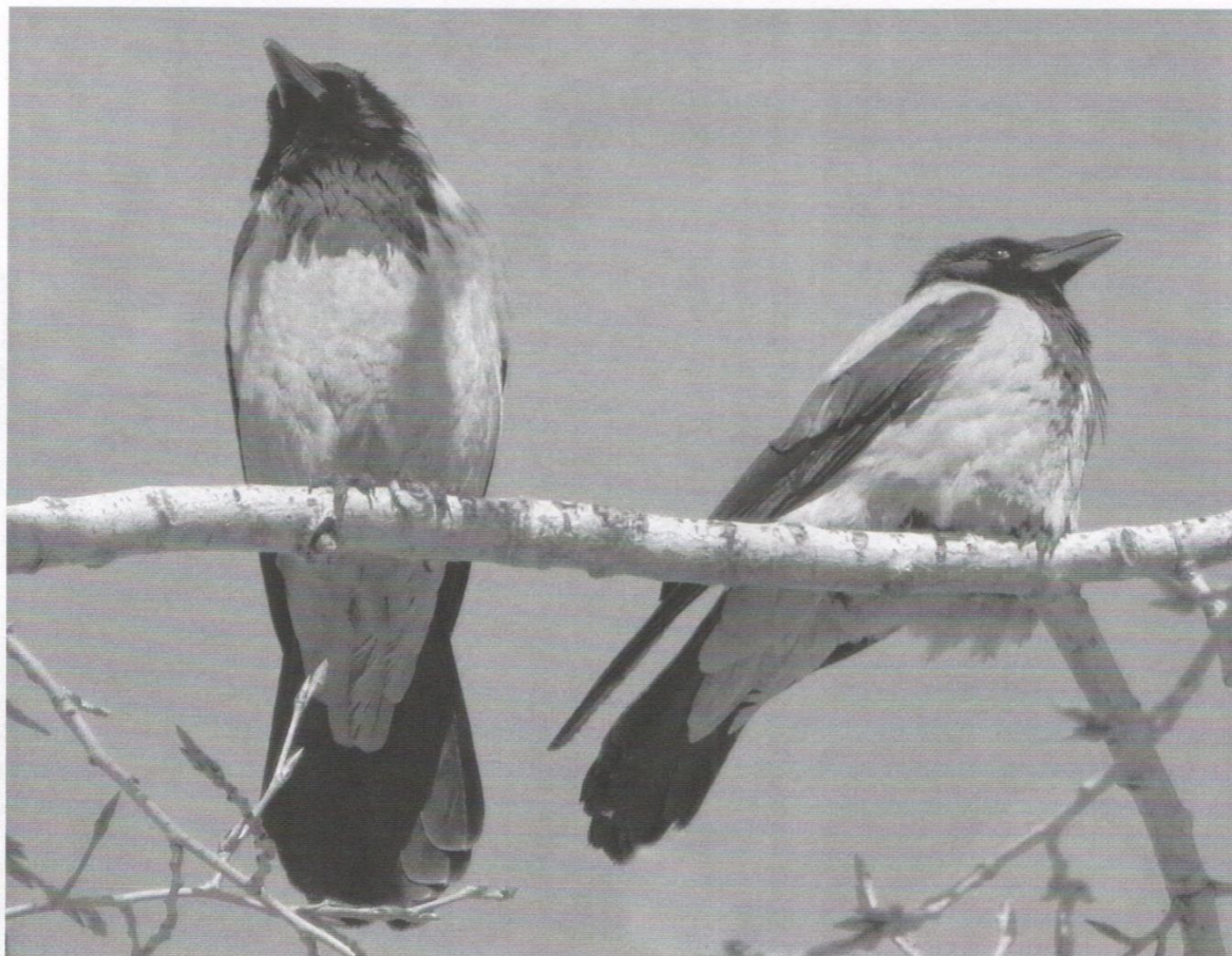
Рис. 9. Молодой (слева) и самка. 05.04.2019 г.

а 5 апреля появилось новое небольшое гнездо у ствола на высоте 10 м на другом тополе вблизи клена со старым гнездом. Его построила самка без правой лапки. С 7 апреля она начала насиживать кладку из 5 яиц: 42 \times 28 , 42.5 \times 28 , 40.5 \times 28 , 43 \times 29 , 43.2 \times 28 мм (рис. 10).