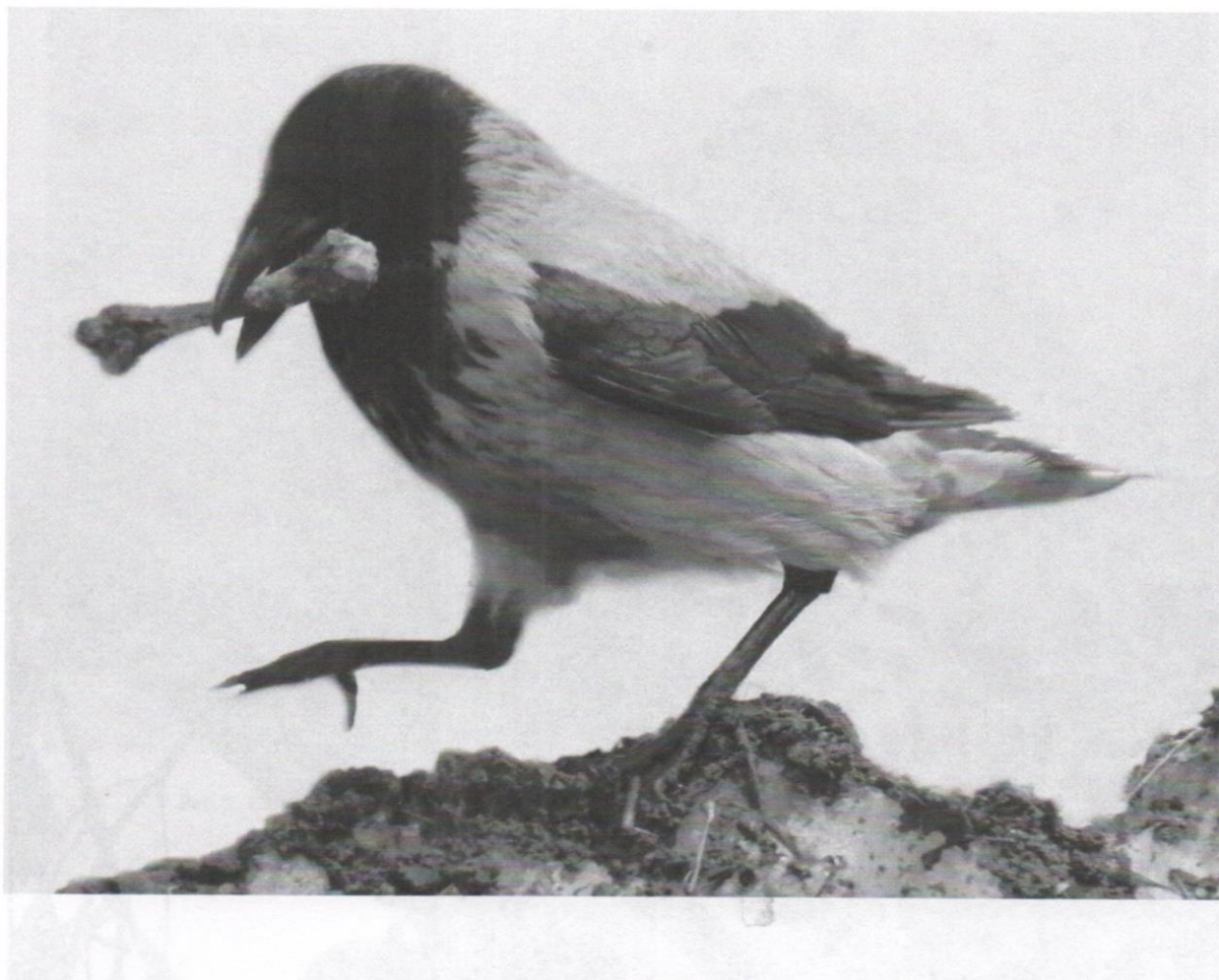
Рис. 5. Птенец с костью. 08.04.2017 г.

Сильно похудевшая особь, судя по габитусу самка, неуверенно перелетала по веткам ближайшего от гнезда клена, у нее был нездоровый вид. Молодой все время держался поблизости, иногда бегал по газону, пытался собирать корм, но брал все подряд наугад. Местные жители пытались подкармливать его хлебом, овсяной кашей. Он пытался клевать, поднимал вверх клюв, но глотать хлеб не получалось, а манную кашу склевывал. Когда ставили пластиковую плошку с кормом и к ней подлетали взрослые, молодой подбегал, хватал клювом плошку, пытался унести ее, опрокидывал. Приносимая ему пища в основном доставалась голубям и никоим образом не “разгружала” ворон-родителей.