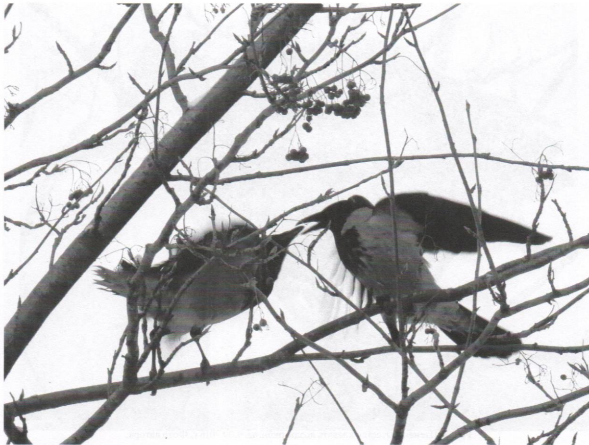
Рис. 2. Кормление. 12.10.2016 г.

У него был нарушен акт глотания — рефлекторный мышечный акт, при котором в результате поочередного сокращения и расслабления мышц пищевой комок (болюс) переводится через глотку и пищевод в желудок. Ротовая фаза — произвольная, может управляться сознанием, глоточная — непроизвольная, быстрая, короткая. Нарушение акта глотания (дисфагия), вероятно, было связано с ненормальным развитием подвижного нёба и подъязычного аппарата.