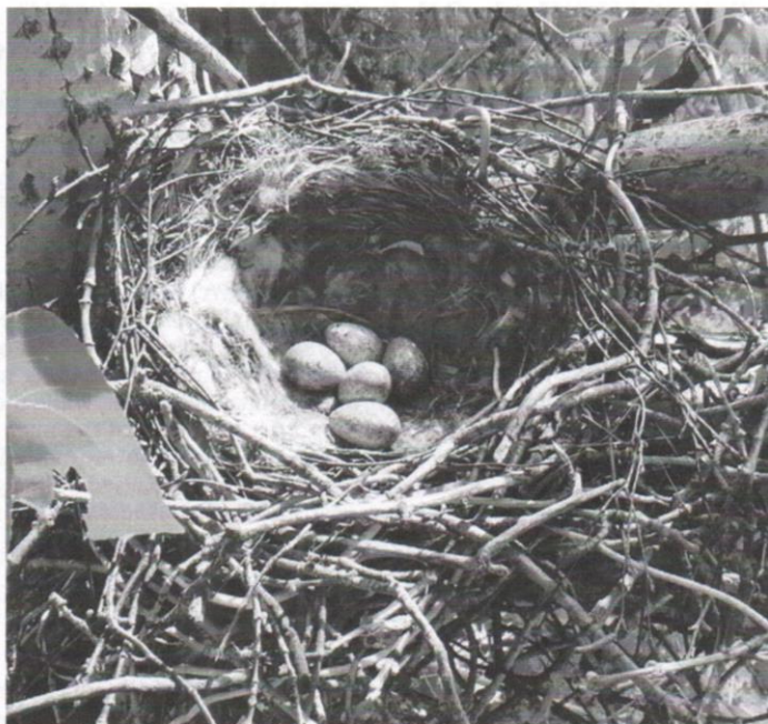
Рис. 10. Последняя кладка. 20.05.2019 г.

дислокацию в пределах гнездовой территории: небольшой части квартала, ограниченной жилыми зданиями. Продолжая кормить его и по окончании послегнездового этапа, самка ежегодно приступала к откладке яиц и насиживанию, даже после того, как получила увечье сама, а затем и у самца оказались повреждены пальцы обеих ног, а после его гибели «прибегла» к тесному инбридингу. Вследствие недостаточности питания самка была вынуждена покинуть гнездо, и когда самцу приходилось добывать корм на троих, а затем, когда она одна добывала его для себя и потомка. В результате этих вынужденных отлучек при крайне неблагоприятных погодных условиях в инкубационные периоды в течение всех трех лет подряд кладки погибали от переохлаждения. При насиживании в норме 18–21 сутки в экстремальных условиях самка неудачно насиживала в 2017 г. — 41 сутки (7.04–17.05); в 2018 г. — 18 суток (10.04–27.04, брошено) и повторно в новом гнезде 38 суток (14.05–18.06); в 2019 г. — 51 сутки (7.04–27.05).