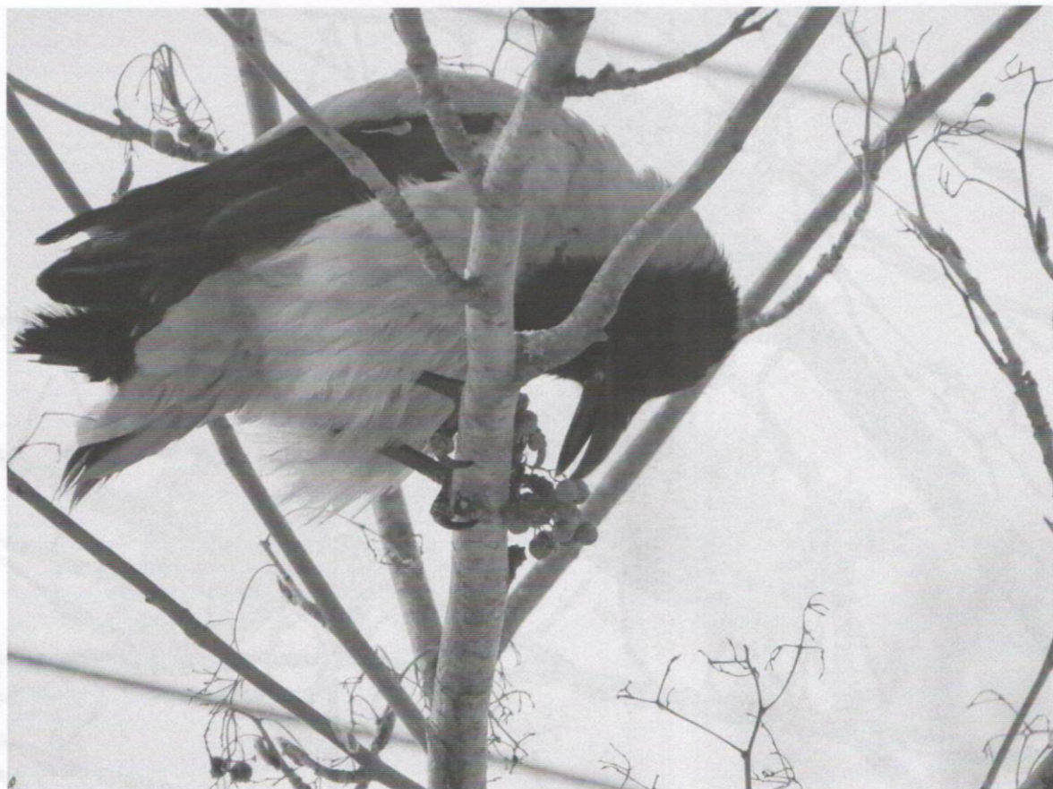
Рис. 3. Птенец пытается клевать ягоды рябины. 9.09.2016 г.