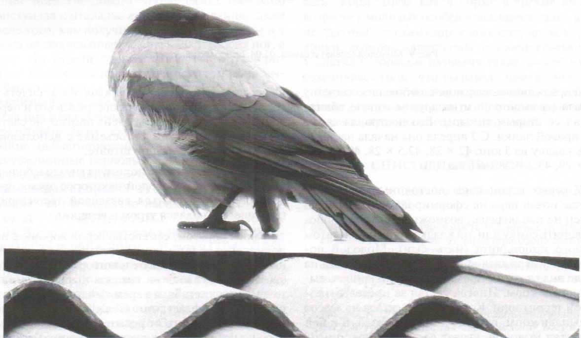
Рис. 8. Одноногая самка. 22.06.2018 г.