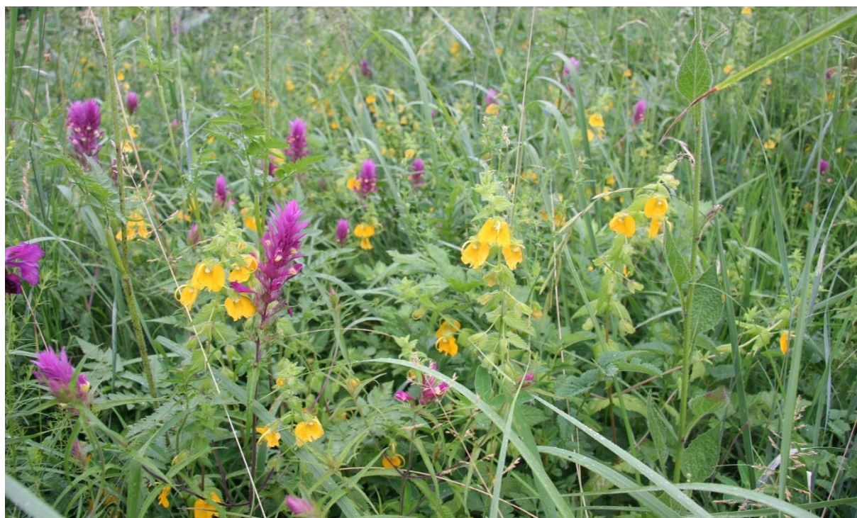
Рисунок 3 – Разнотравные луга с элементами субальпийского высокоотравья на склонах горы Кизинчи

кавказского элемента в петрофитных группировках. На склонах горы сформировался особый тип травянистой растительности из смеси луговых видов трёх поясов от нижнего до альпийского горного пояса. Луга отличаются высоким уровнем флористического разнообразия, широким диапазоном разнотравно-злаковых сообществ. Доминантами злаково-разнотравных сообществ являются злаковые виды: золотобородник цикадовый ( Chrysopogon gryllus (L.) Trn.), бородач кровеостанавливающий ( Bothriochloa ischaetum (L.) Keng), трясунка высокая ( Briza elatior Sibth. et Smith), которые в других аналогичных ценозах не играют такой роли (Литвинская, 2021).