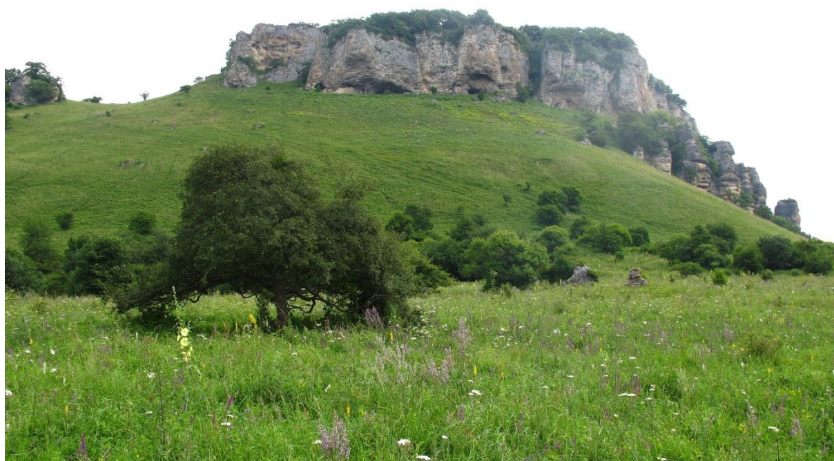
Рисунок 2 – Гора Кизинчи

процессам, которые действовали совместно с явлениями выветривания (Сафронов, 1969). Северный, западный и восточный склон горы Кизинчи пологие, южный склон до середины обрывистый и быстро переходит в довольно пологий склон с выходами доломитов и гипсов. На территории хорошо проявляются карстовые формы рельефа. Крупная карстовая воронка имеется на северном склоне (глубина 30 м). В низкогорной части эрозионная сеть представлена балками, промоинами, расщелинами, щелями. Мостовский район находится в области 4-х геоструктурных зон Северо-Западного Кавказа, которые в тектоническом и морфологическом отношении резко отделяются друг от друга. Наиболее древние из них слагают зоны Главного и Северного Предгорного хребтов, более молодые располагаются на его периферии и представлены 7 породами от четвертичного периода (кайнозойской эры фанерозойского зона) до протерозойской эры докембрийского зона (начало 2,5 млрд лет назад) включительно (Геология СССР..., 1968).