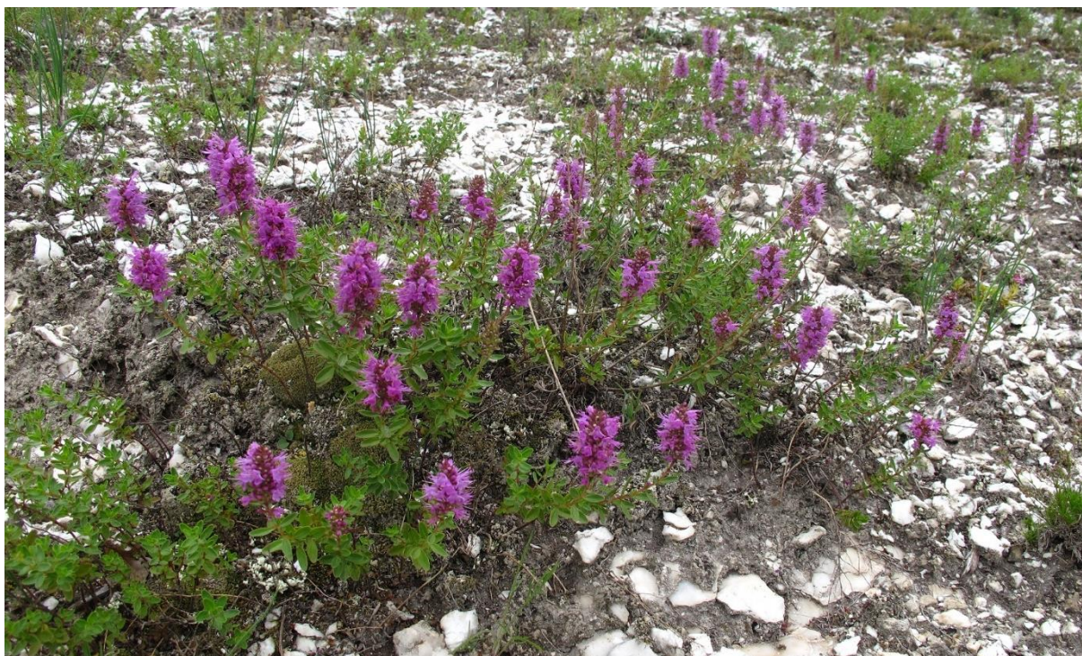
Рисунок 4 – Растительность на гипсах

На остепненных лугах произрастают: ежа сборная ( Dactylis glomerata ), козелец крымский ( Scorzonera taurica M. Bieb.), девясил мечелистный ( Inula ensifolia L.), лен австрийский ( Linum austriacum L.), дубровник белый ( Teucrium polium L.) синеголовник полевой ( Eryngium campestre L.), василёк прижаточешуйный ( Centaurea adpressa Ledeb.). На опушках близ лесных сообществ плотные скопления образуют бузина травянистая ( Sambucus ebulus L.), лабазник вязолистный ( Filipendula ulmaria (L.) Maxim.), произрастают яснотка белая ( Lamium alba L.), борщевик сибирский ( Heracleum sibiricum L.), бородавник обыкновенный ( Lapsana communis L.), девясил великолепный ( Inula magnifica Lipsly).