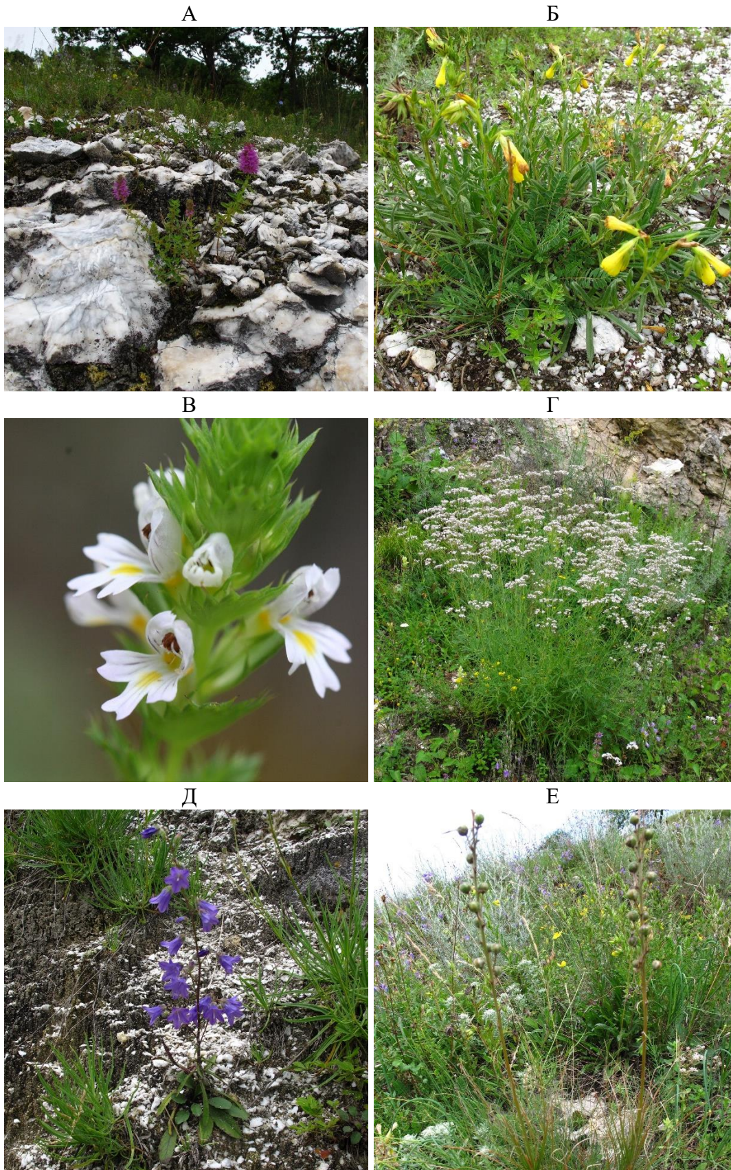
Рисунок 6 – Виды гипсового флорокомплекса: 6А – Чабрец красивенький Thymus pulchellus ; 6Б – Оносма кавказская Onosma caucasicum ; 6В – Очанка Альбова Euphrasia alboffii ; 6Г – Качим Мейера Gypsophila meyeri ; 6Д – Колокольчик Литвинской Campanula litvinskajae ; 6Е – Асфоделина тонкая Asphodeline tenuior