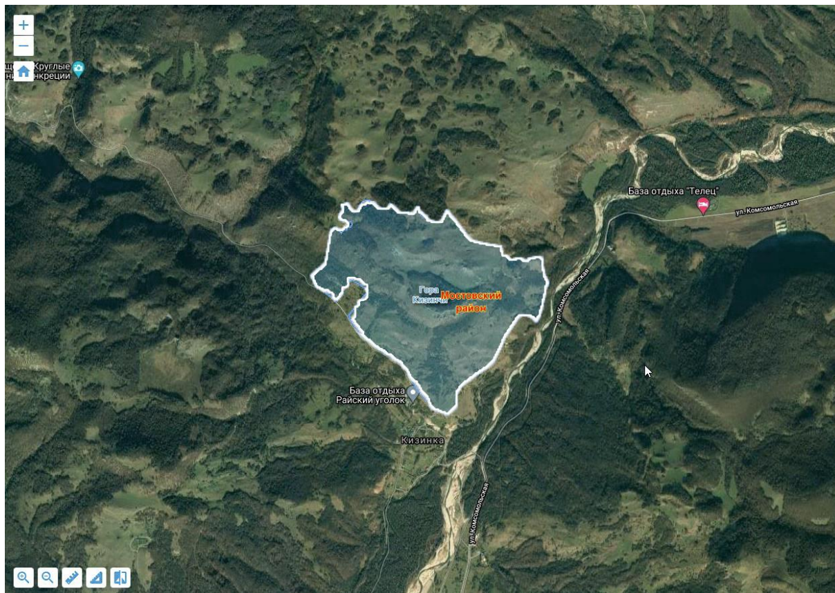
Рисунок 1 – Положение ООПТ на географической карте

Гора Кизинчи (595 м н.у.м.) объявлена памятником природы постановлением главы администрации (Губернатора) Краснодарского края от 05.08.2021 № 454. Площадь 286,5051 га. Координаты: 44°13' 038"N, 40°35' 404"E. Гора Кизинчи находится в междуречье рек Кизинчи и Ходзь (рис. 1).