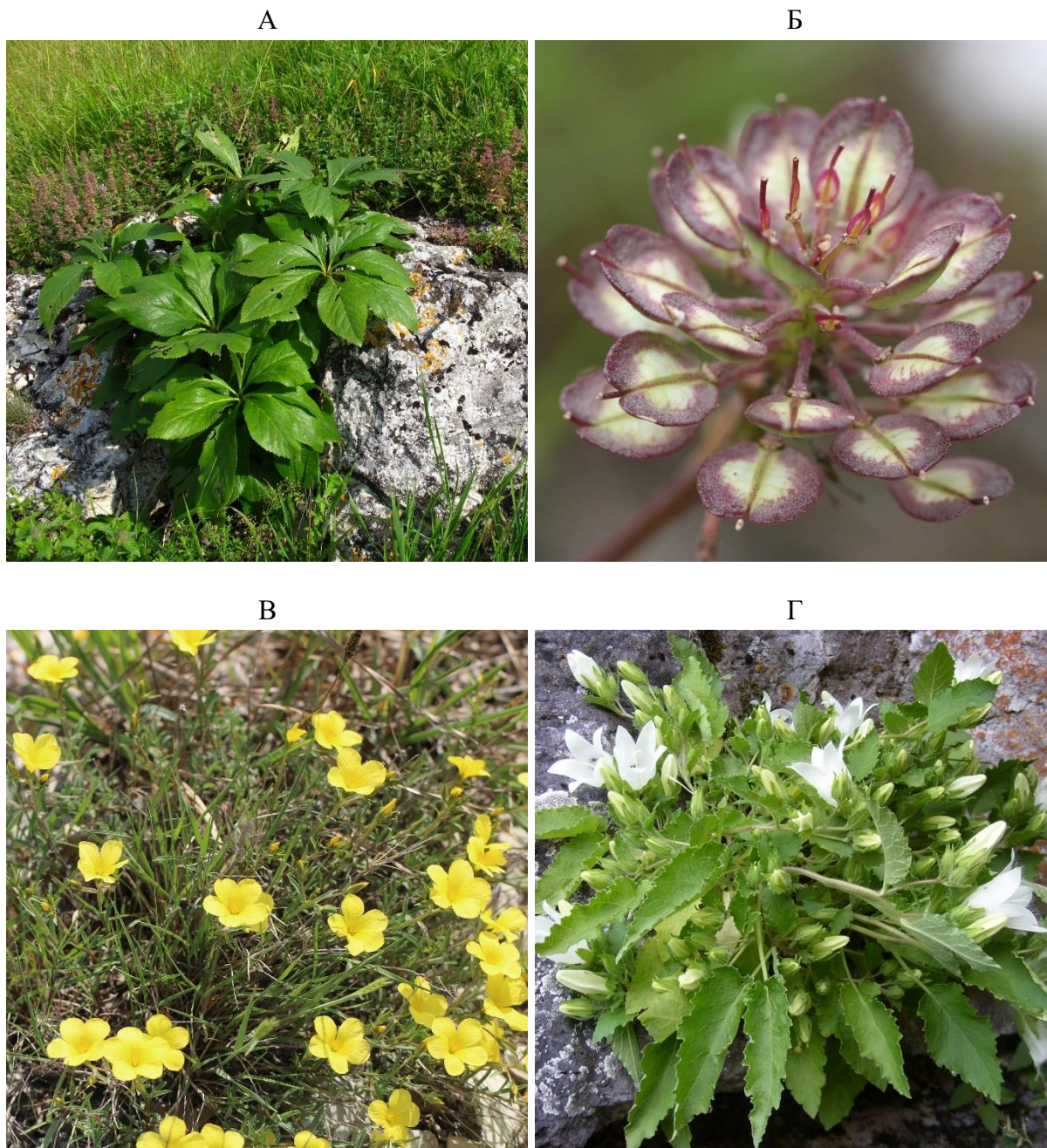
Рисунок 7 – Редкие виды памятника природы «Гора Кизинчи»: 7А – Морозник кавказский Helleborus caucasicus ; 7Б – Иберийка крымская Iberis taurica ; 7В – Лен крымский ( Linum taurica ); 7Г – Колокольчик повислый ( Campanula pendula M. Vieb.)

К редким и уникальным сообществам следует отнести нагорно-ксерофильные группировки на доломитах (рис. 5) и гипсах (рис. 6), четко отличающиеся флористическим составом; луга с элементами субальпийского высокоотравья и высокогорных лугов (рис. 3); злаково-разнотравные сообщества с доминированием золотобородника цикадового ( Chrysopogon gryllus (L.) Trn.), бородача кровеостанавливающего ( Bothriochloa ischaetum (L.) Keng).