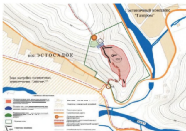
Рис. 1. Схема функционального зонирования территории, занимаемой Ачипсинской крепостью.

Также положительным моментом в деле музеефикации Ачипсинской крепости является ее расположение вблизи крупных туристских комплексов на окраине поселка Эсто-Садок. На окраине поселка возле моста через Мзымту, находится недавно построенный ресторан «Поляна», от которого ведет наверх туристическая тропа, которая выводит на городище. На другом берегу реки Ачипсе построен гостиничный комплекс компании «Газпром».