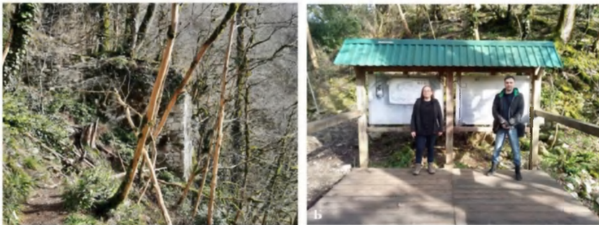
Рис. 3. Средневековая крепость на территории Тисо-самшитовой рощи: вид на сохранившуюся северо-западную башню крепости (А); научные сотрудники учреждений во время экспедиции на крепость (Б).

Подобная практика имеет перспективу дальнейшего продолжения совместной работы. Особенно это имеет отношение к району посёлка Красная Поляна, где ряд объектов оборонительного зодчества раннесредневекового периода находятся недалеко друг от друга, но принадлежат двум вышеназванным учреждениям.