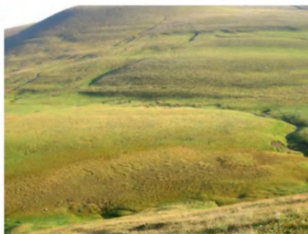
Рис.5. Оштенское болото.

Специальное обследование двух крупных болотных массивов – Луганского и Дзитацкого – с подробным описанием и картированием растительности, отбором проб