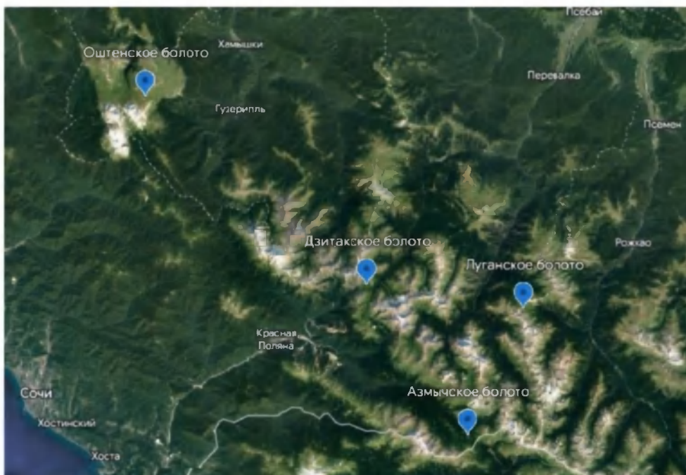
Рис. 1. Расположение высокогорных болот на территории Кавказского заповедника.