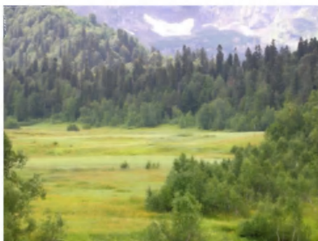
Рис. 4. Азмышское болото.