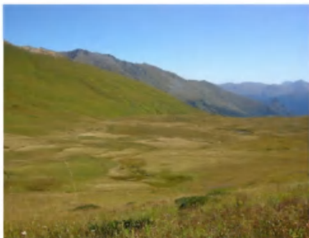
Рис. 2. Луганское болото.