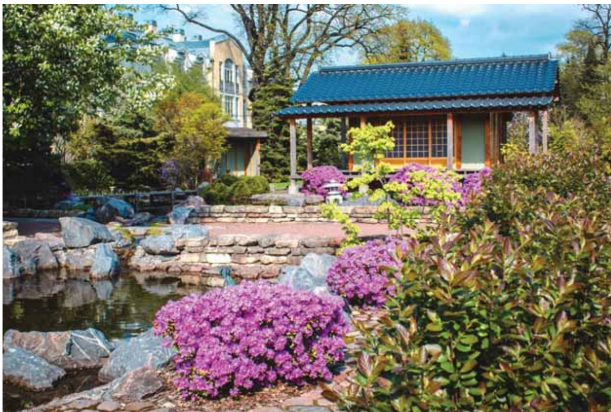
Рисунок 2 – Экспозиция «Японский сад» на территории ООПТ Ботанический сад Петра Великого

И, как следствие, рост посещаемости влечет за собой расширение штатного расписания увеличение числа сотрудников в последние годы (таблица).