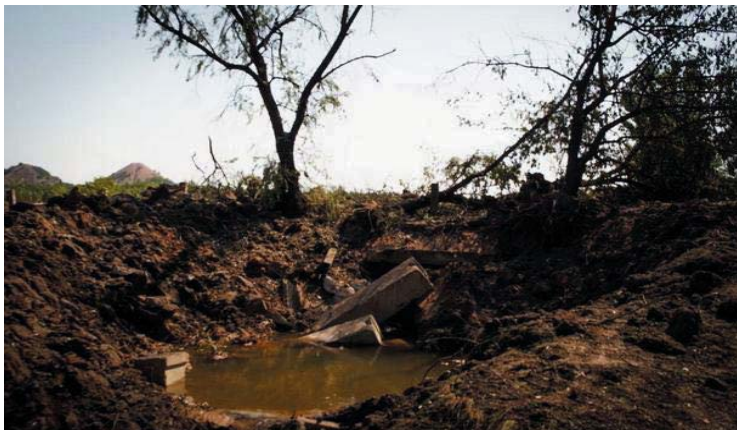
Рис. 2. Воронка от разрыва снаряда.

В целях повышения эффективности работы питомника необходимо учесть ряд факторов. Т.к. многие растения могут не прижиться после их высадки из питомника, то следует выращивать наиболее неприхотливые породы деревьев. Такими являются акация и тополь. Также можно выращивать растения в отдельных контейнерах, что позволит сохранить в целостности корневую систему и повысит приживаемость при высадке.