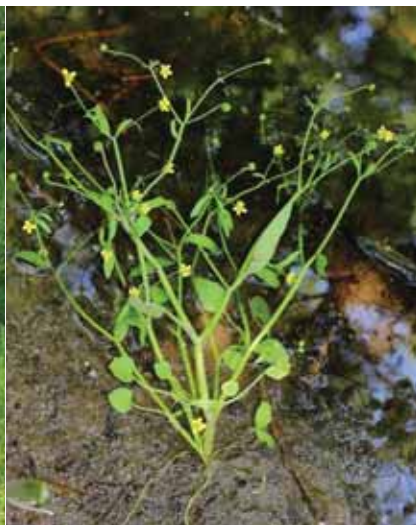
Рисунок 4 – Лютик уховниколистный Ranunculus ophioglossifolius :