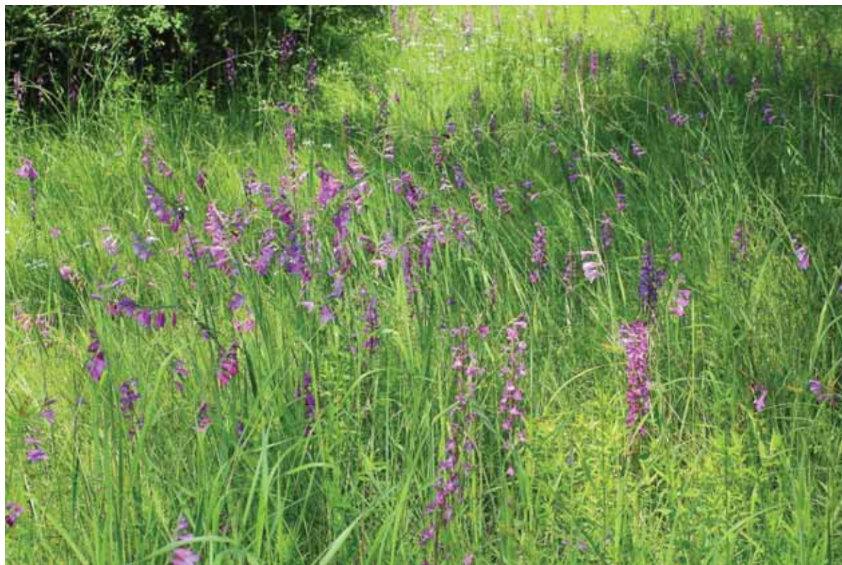
Рисунок 5 – Сезонно переувлажненный разнотравно-злаковый луг с цветущими гладиолусом тонким и анакамптисом рыхлоцветковым (27.05.2017)

Б – цветущее и плодоносящее растение (27.05.2017)