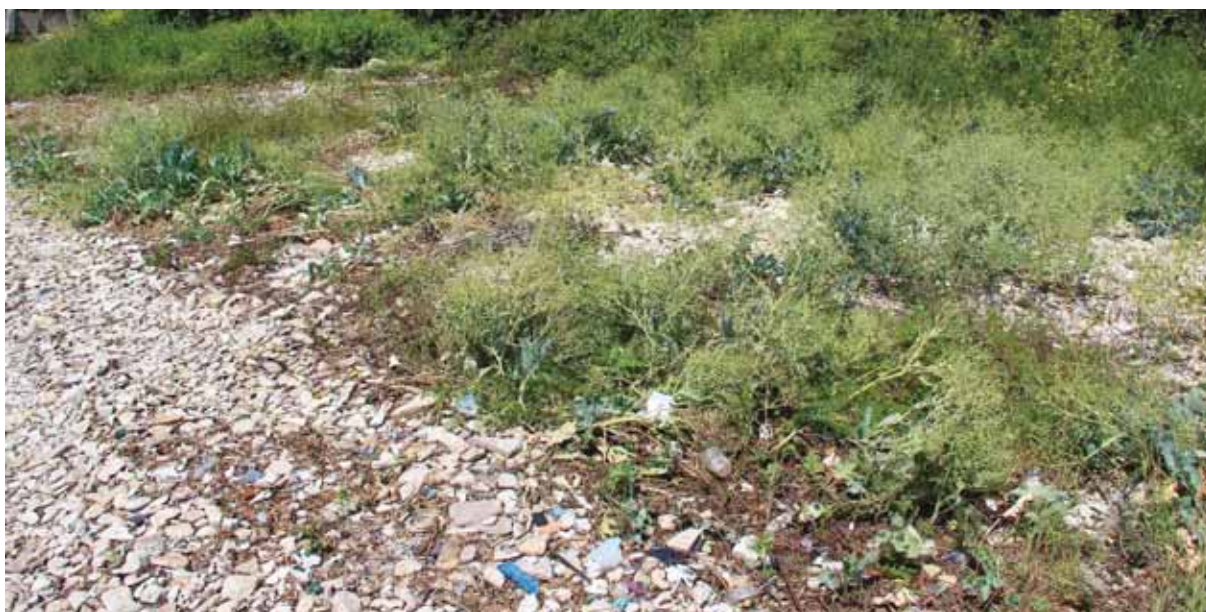
Рисунок 3 – Поврежденная тяжелой техникой литоральная растительность, после очистки пляжа от мусора и водорослей (там же, 28.05.2019)