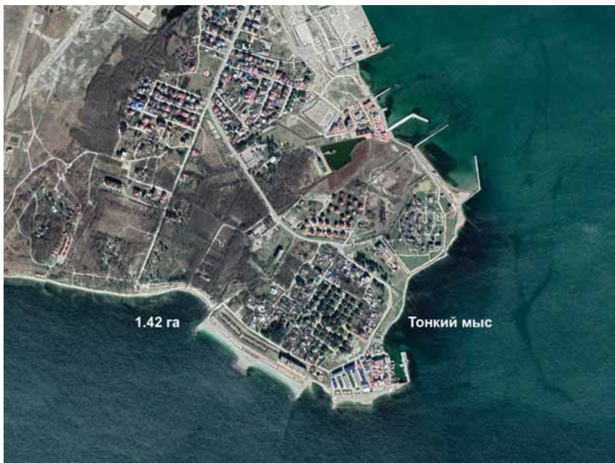
Рисунок 1 – Карта-схема расположения природного комплекса «Заболоченный участок на Тонком мысу»

Растительность галечного пляжа представлена типичной для Северо-Западного Закавказья (СЗЗ) литоральной растительностью, в состав которой входят краснокнижные виды сосудистых растений: морковница приморская Astrodaucus littoralis (M.Bieb.) Drude, катран морской Crambe maritima L., витекс священный Vitex agnus-castus L.; а также редкие для СЗЗ виды: Халимион бородавчатый Halimione verrucifera (M.Bieb.) Aellen, Воронья лапа чешуйчатая Coronopus squamatus (Forssk.) Asch.