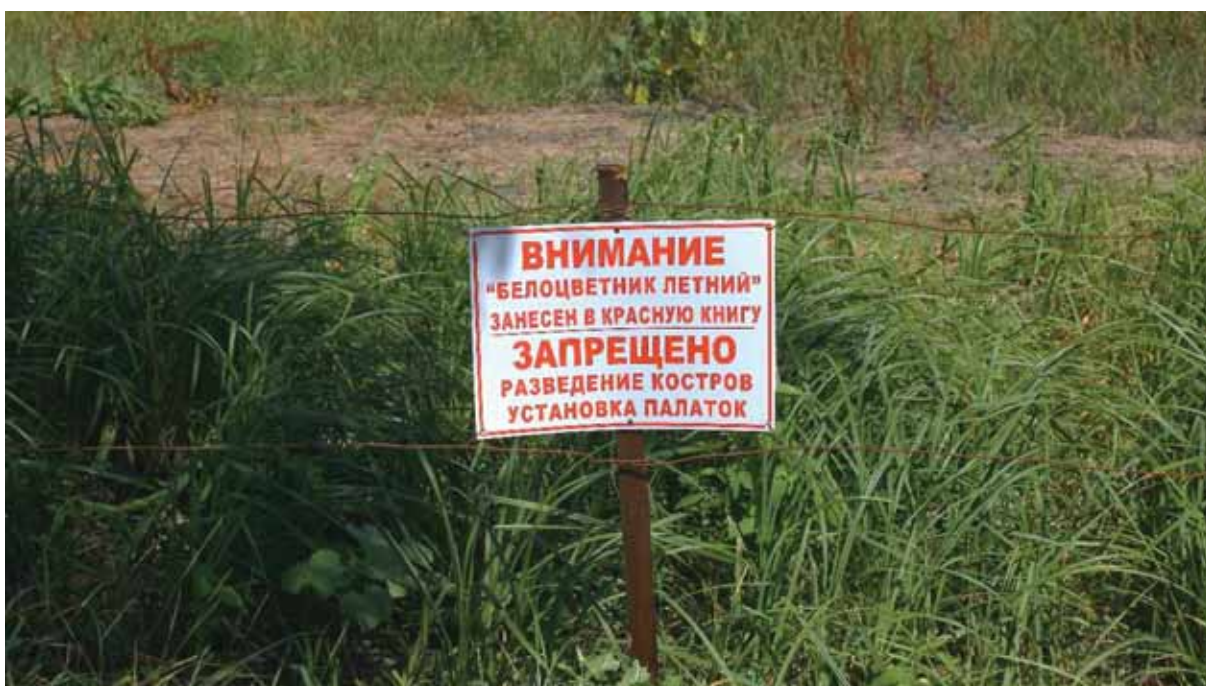
Рисунок 9 – Информационный стенд, установленный экологической общественностью города Геленджика на границе природного комплекса «Заболоченный участок на Тонком мысу»

Сохранность популяций редких и охраняемых видов сосудистых растений, имеющих федеральный и региональный статус охраны, вызывает крайнее опасение, т.к. они расположены на муниципальных землях, категория земель позволяет строительство капитальных зданий. В связи с