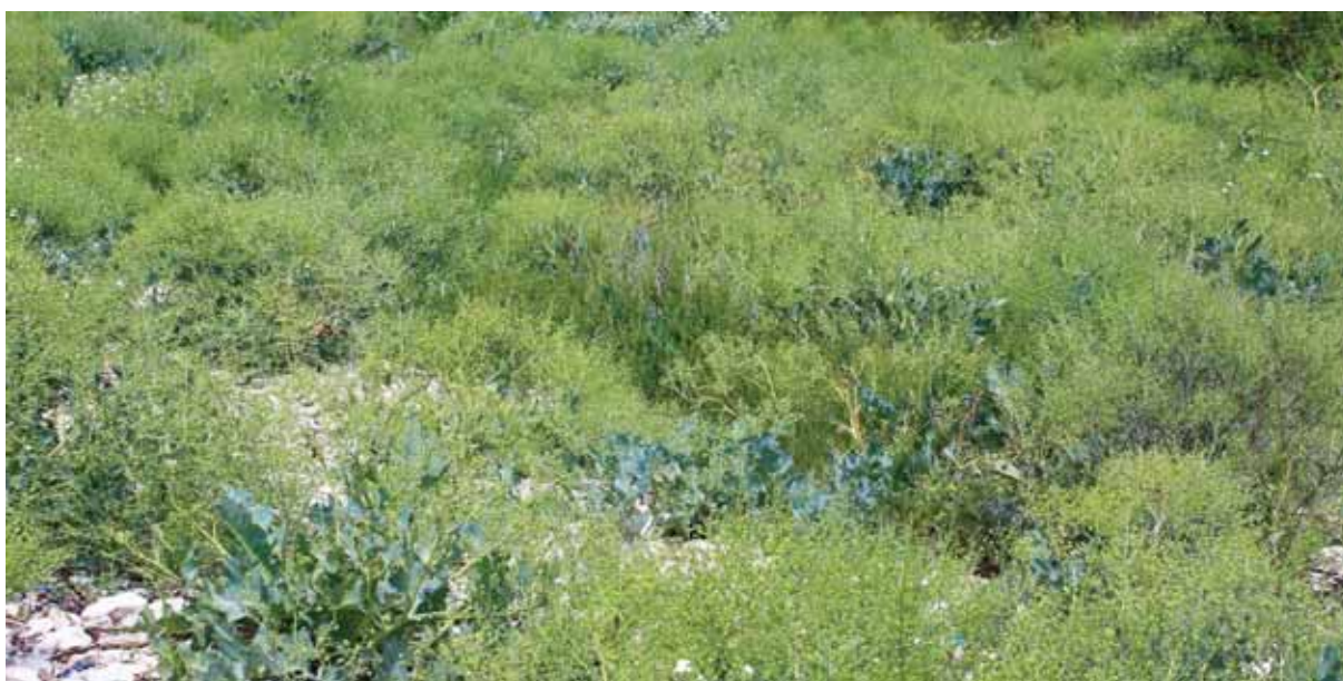
Рисунок 2 – Литоральная растительность в природном комплексе, доминирование катрана морского (27.05.2017)

В мае 2019 г. впервые отмечены в природном комплексе краснокнижные виды: