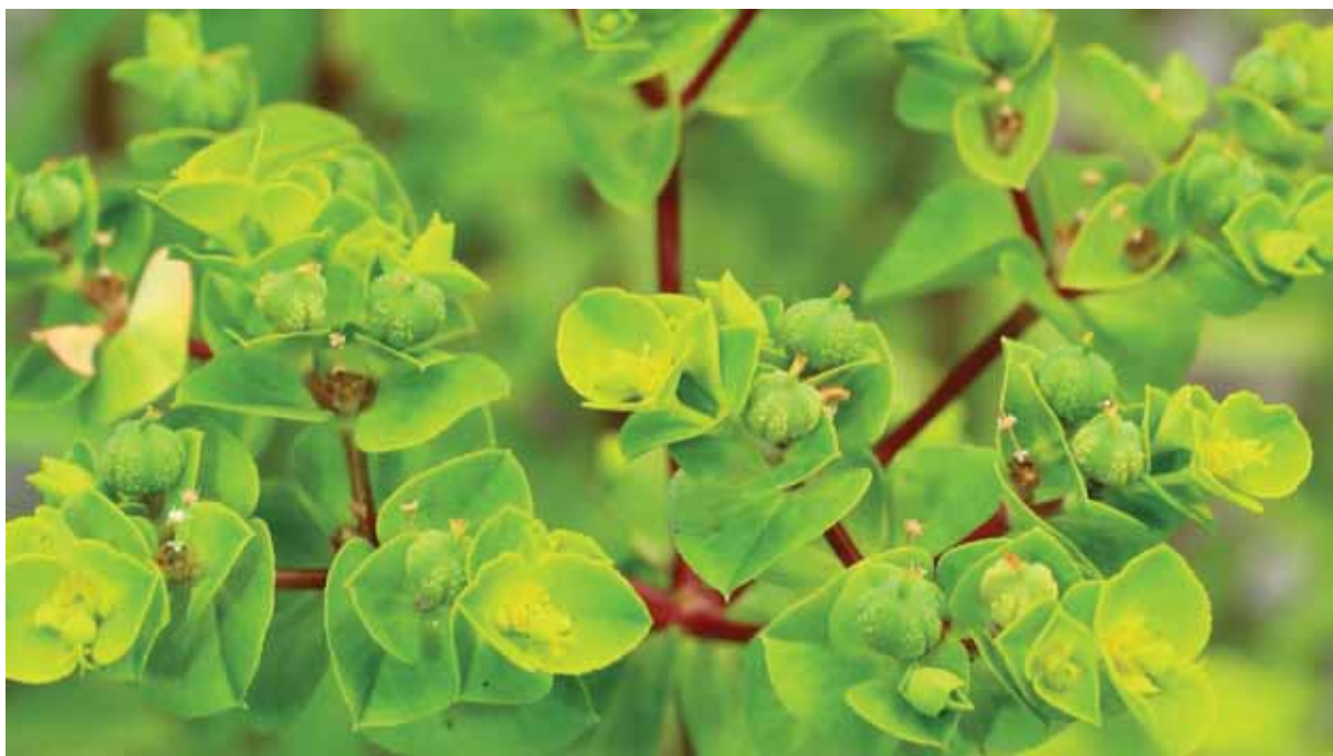
Рисунок 8 – Молочай плосколистный Euphorbia platyphyllos L.: часть соцветия с плодами (Тонкий мыс, 11.07.2016)