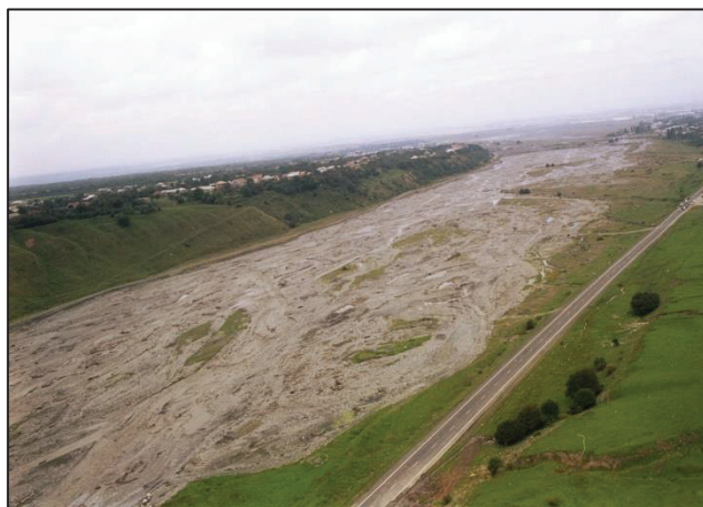
Рис. 3. Нижняя часть зоны распада низкоплотного селя водно-ледово-грязевого состава. Примечательным 21-22 сентября 2002 г. было наличие на поверхности ярко белых глыб (до 0,5 м в поперечнике) высокогорного снега – фирна. На высокой террасе левого борта долины – с. Верхняя Саниба, на заднем плане, на правом берегу – с. Гизель.

Нижняя часть высокоплотного селя (рис. 3) имела протяжённость 3,7 км до отметки 780 м; общий уклон 0,024 (или 1°23') и отличалась дальнейшим уменьшением скоростей (до 33 м/сек.) и объёмов движущихся масс. По экспертной оценке первоначальный объём этой части мог достигать 3 млн. м 3 , в т.ч. твёрдой составляющей до 2 млн. м 3 .