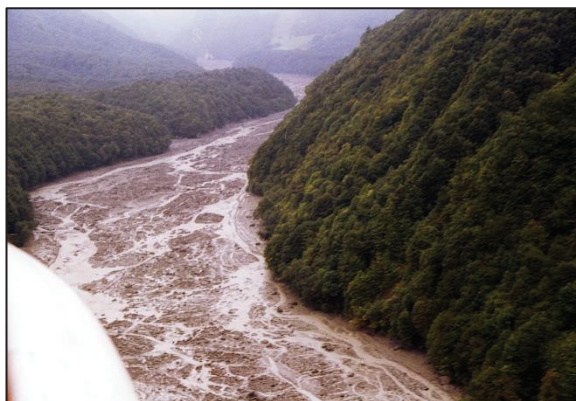
Рис. 2. Вид вниз (на север) по течению реки. Отложения гляциального селя верхней части участка «высокой плотности» до устья р. Геналдон. Поверхность отложений ровная, с многочисленными ветвящимися водотоками.

Верхняя часть , протяжённостью 5,2 км, от окончания зоны транзита на выходе из узкой щели каньона до устья р. Геналдон (рис. 2), где дно долины было пересечено дорожной насыпью высотой до 3 м над активной поймой р. Геналдон, отметка 869,0, уклон 0,025 (или 1°25'). Объём селевых масс в этой части оценивался в 6,7 млн. кубометров, а твёрдой составляющей, после таяния льда в 2004 г. в 4,5 млн. м 3 .