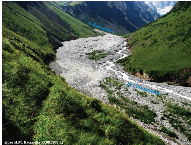
Рис. 6. Отложения гляциального селевого потока с верховьев р. Кайсардон, сошедшего 29.07.2007 г. Объем селевого выброса – более 200 тыс. кубических метров. На снимке эти отложения отличаются светлой окраской и на их поверхности нет растительности.

Активизация гляциальной селевой деятельности в перигляциальной зоне ледников приходится на конец июля 1998 г., когда селевые отложения объемом около 500 тыс. м 3 перекрыли флювиогляциальную пойму р. Сонгутидон на протяжении 2,1 км от устья реки Кайсардон. Поток низкой плотности по руслу Сонгутидона достиг с. Дунта, пройдя 3,1 км. 29 июля 2007 года сошел следующий селевой поток объемом более 200 тыс. м 3 (рис. 6).