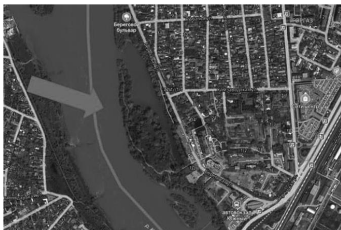
Рис. 1. Местоположение ООПТ «Остров Масленицы»

сохранение городских пойменных лесных биогеоценозов для рекреационного использования.