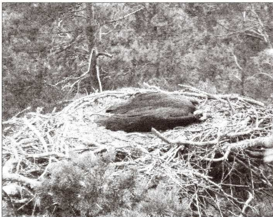
Рис. 2. Птенец черного грифа накануне вылета (23.07.2010).

При повторном посещении гнезда 23.07.2010 мы обнаружили на гнезде подростшего птенца (рис.2), который сушил крылья после небольшого дождя. Высушив крылья, птенец несколько раз махал ими и довольно высоко подпрыгивал, так что создавалось впечатление, что он вот-вот полетит.