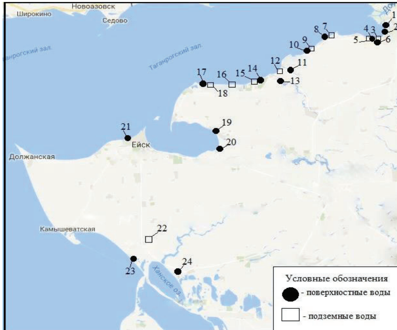
Рис. 1. Карта-схема расположения станций отбора проб на юго-восточном побережье Азовского моря

прибрежной зоне моря (рис. 1). Кроме этого, в питьевых скважинах и колодцах выполнен отбор проб грунтового (первого от поверхности) и межпластовых горизонтов подземных вод, для определения в них содержания фторидов, минерализации, ионного состава и других ингредиентов и показателей качества вод.