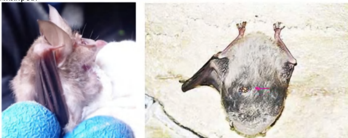
Рис. 5. Южный подковонос и длиннокрыл с кровосоской.

Последнее обследование колонии южного подковоноса ( Rhinolophus euryale BLASIUS, 1853, (рис. 5) в пещ. Мордвиновская выявило высокий уровень интенсивности зараженности всеми эктопаразитами, в особенности, кровососками (интенсивность зараженности = 2.8 \pm 0.1 ). На одной особи было отловлено даже 10 экземпляров.