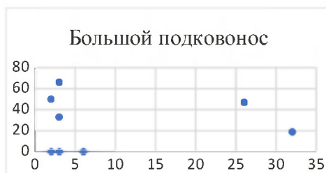
Рис. 3. Зараженность эктопаразитами большого подковоноса (Y - %) в связи с их количеством на убежище (X -ос.).

У больших подковоносов такой явной линейной зависимости не наблюдается (рис. 3), хотя группируемость у них в крупные компактные скопления проявляется более явно в самую холодную часть года.