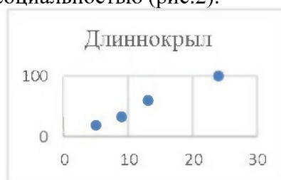
Рис.2. Зараженность эктопаразитами длиннокрылов (Y-%) в связи с их количеством на убежище (X-ос.).

Установленная линейная зависимость зараженности и численности длиннокрылов в убежище связана с их высокой социальностью (рис.2).