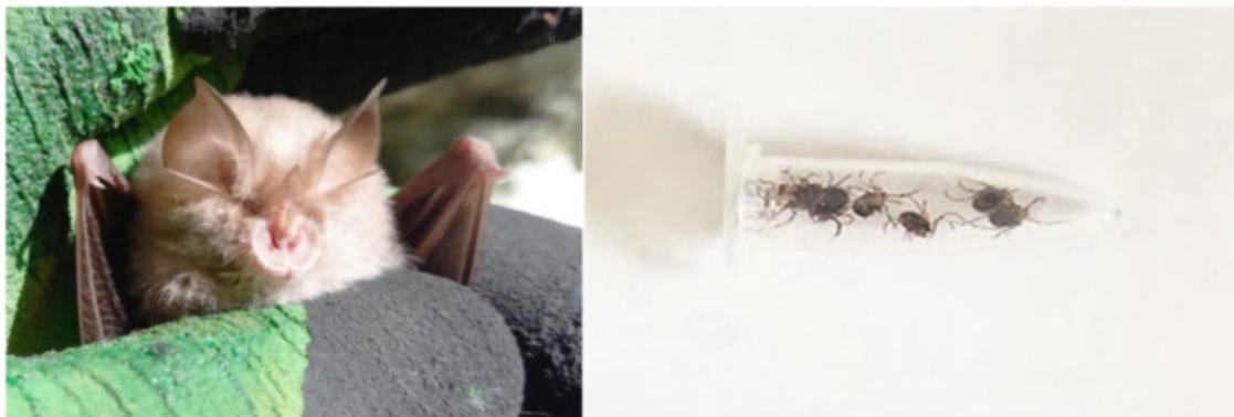
Рис. 1. Маленький подковонос и собранные для определения клещи.

Большие подковоносы более социальны, что выражается у них даже в коллективной охоте и богатом спектре социальных сигналов, обнаруженных в материнских колониях (Andrews, Andrews 2003).