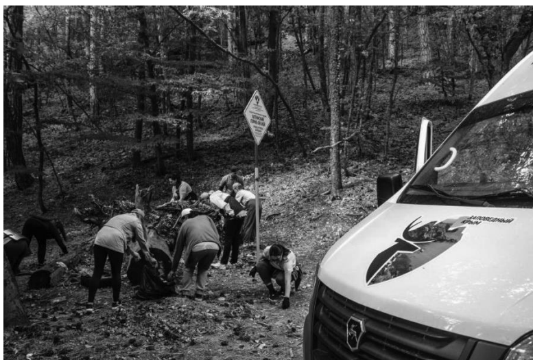
Рис. 1. Уборка обочины Бахчисарайского шоссе от мусора (Ю. Махаонова)

В период с 10 по 11 сентября 2022 г. активисты провели анкетирование среди посетителей ЯГЛПЗ, задавая вопросы об удовлетворенности туристами досугом, количеством и качеством эколого-просветительских маршрутов, а также о желании поучаствовать в эковолонтерской школе в следующем году (Рис. 2).